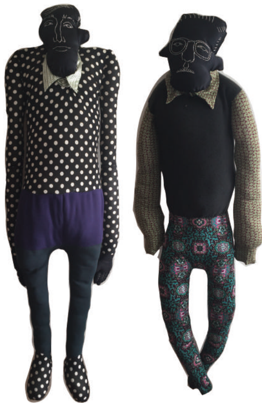
© Jasmine Fulford All Rights Reserved