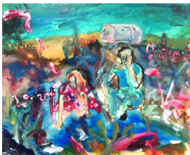
「No More Songs」 © Yumeno

詩的な感覚を生かし、さまざまな物語を並行して描いている夢乃による、今、この瞬間の世界をどうぞご体験ください。