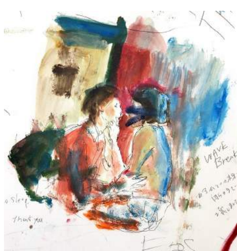
「Trantision」 © Yumeno